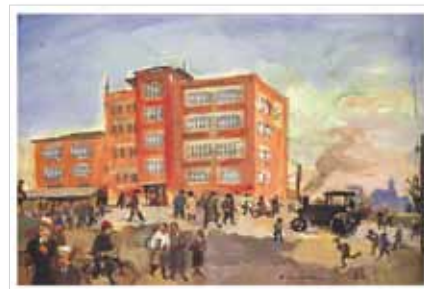
„Die Goldbergschule 1933“ nach einem Gemälde von Fritz Steisslinger

Zusammen mit den Eltern und Schülern haben wir im Jahr 2006 ein Leitbild für unsere Schule erarbeitet (siehe Seite 2).