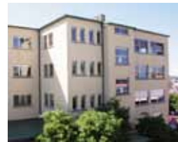
Goldberg-Gymnasium Frankenstraße 15 71065 Sindelfingen

Fahrräder können sowohl auf den vielen überdachten Stellplätzen innerhalb des Schulgeländes als auch in unserer bewachten Fahrradgarage untergestellt werden.