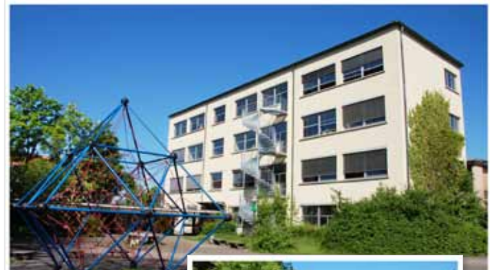
Süd- und Altbau