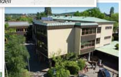
Oberstufen- und Nordbau