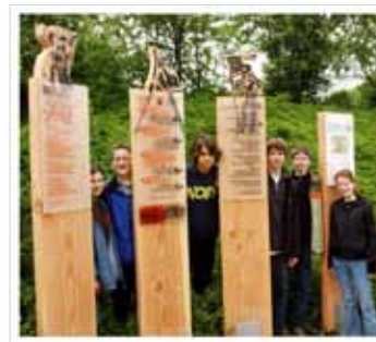
„Das Denkmal für die Opfer des Bauernkrieges haben Goldberg-Schüler selbst erstellt.“

Das Goldberg-Gymnasium bietet im Rahmen des Bundeswettbewerbs „Jugend debattiert“ seinen Schülern ab Klasse 8 die ideale Gelegenheit, ihre Diskussionsfähigkeit zu verbessern. Alle Teilnehmer werden in einem Rhetorik-Kurs gezielt auf die schulinternen bzw. landes- und bundesweiten Wettbewerbe vorbereitet.